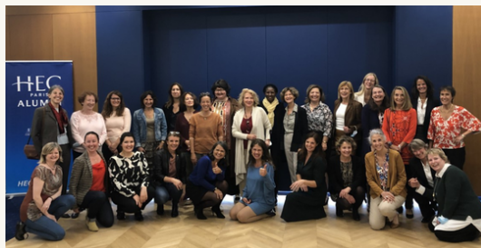
L'équipe HEC Au Féminin